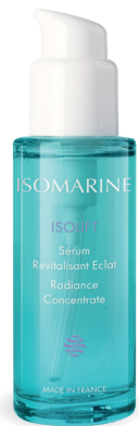
Sérum Revitalisant Eclat