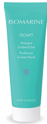
Masque Sorbet Éclat