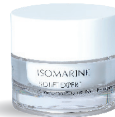
Crème-masque de nuit Repulpante

Le soin de nuit intensif anti-âge lissant.