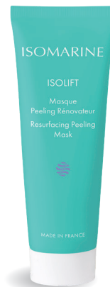
Masque Peeling Rénovateur