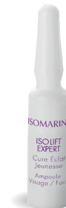
Cure Éclat jeunesse

Le shot intensif. 7 jours pour un effet éclat et lissant.