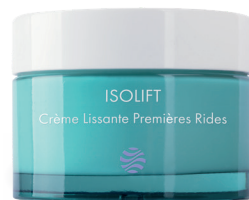
Crème Lissante Premières Rides

Le premier soin prévention anti-âge et éclat.